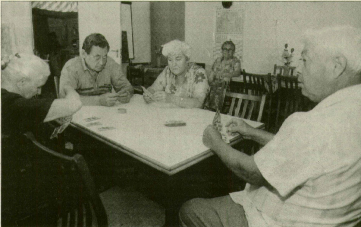
Videózás helyett maradt a kártyázás az idősök napközijében.

Az utóbbi két hónapban kétszer törtek be Szegeden az 1. számú Gondozási Központba, az idősök napközi otthonába.