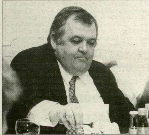
Van „étvágy” az NB II-re is...