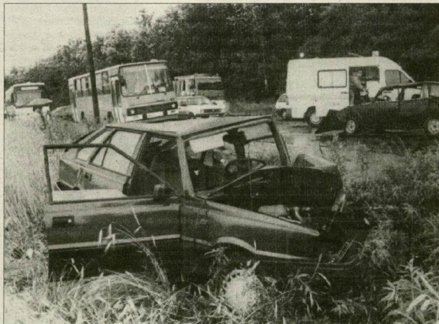
Talán a csoda is segített, hogy ebből az autóból élve szállhattak ki az utasok.

A Lada vezetője ütközéstől tartva fékezett. Bár a lengyel sofőr – kinek autójában vele együtt szintén három