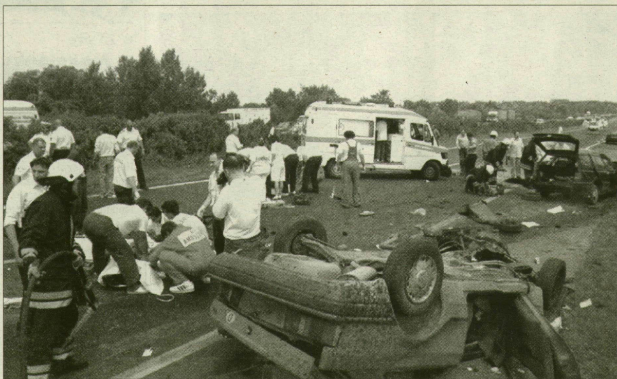
Két halálos áldozata volt egy balesetnek csütörtökön délelőtt az M7-es autópályá 35-ös kilométerszelvényénél. A jobb pályán haladó német rendszámú Ford Escort személygépkocsi, az elválasztó zöldsávot áttörve, frontálisan összeütközött egy Volkswagen Golfal, amely a bal oldali pályán haladt. A balesetben ketten meghaltak, hárman megsérültek, egyikőjüket a tűzoltók emelték ki a roncsok közül.