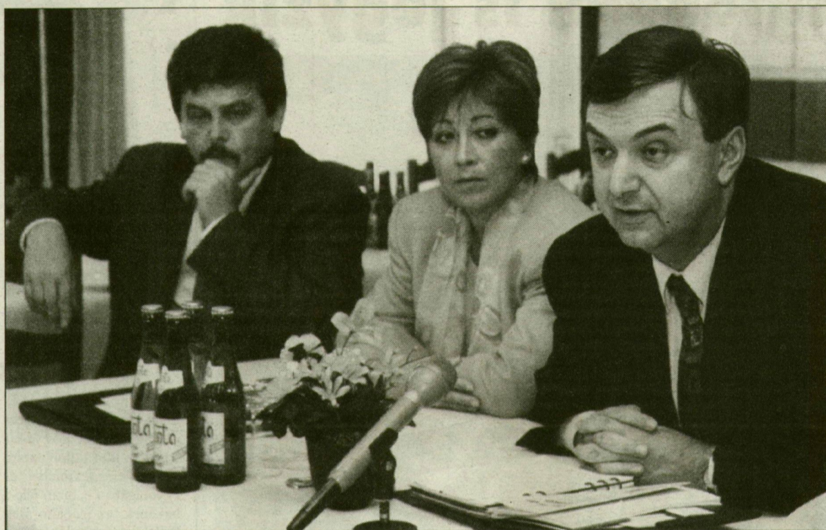
Két képviselő, Géci József és Rózsa Edit is „hallgatott” Kökény Mihály államtitkára.

A tegnap, vasárnap kezdődött Jó napot Szeged! elnevezésű, egészségvédő, betegséggel megelőző programokat felvonultató hét első napján ellátogatott Szegedre Kökény Mihály, népjóléti miniszter. Megbeszéléseket folytatott a SZOTE, a városi kórház és más szegedi egészségügyi intézmények vezetőivel, látogatást tett az SOS Lelkisegély Szolgálatnál, valamint a szegedi Gyermekeket Jóléti Szolgálatnál. Délután a helyi média képviselőit fogadta sajtóbeszélgetésen.