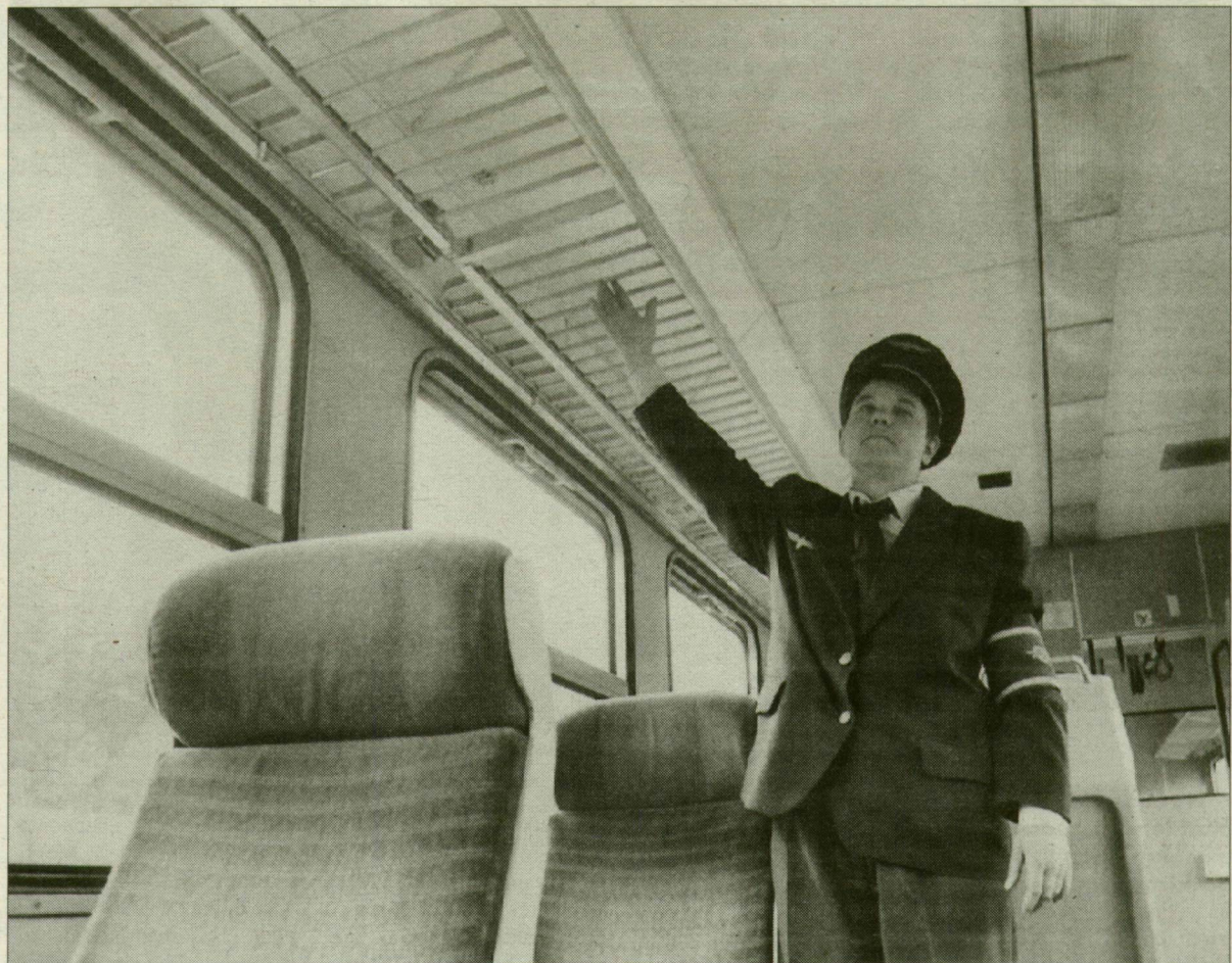
Lopják a csomagtartókat is. A miskolci gyorson ez a „legkelendőbb” magyar termék.

Több mint 81 millió forintos kár érte tavaly a MÁV Rt. Szegedi Területi Igazgatóságát azért, mert ismeretlen tettesek megromlították a sorompókat, ellopták a teher- vagonokból az árut, fölgújtották a vasúti kocsikat, kibelegzték az üléseket. Ez az összeg megfelel egy körülbelül 500 embert foglalkoztató cég éves nyereségének. A vasút azonban jócskán deficitese, tavalyi vesztesége 18,5 milliárd forint volt, s az idei sem lesz alatta a 14 milliárdnak. A károkat tehát csak a minuszokat szaporítják.