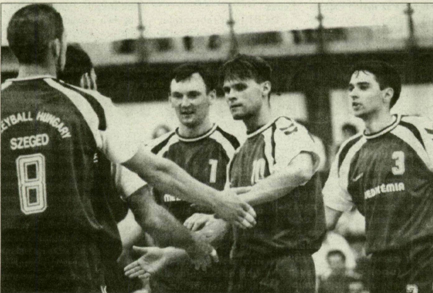
Ismét „egymásra találtak” a medikémiasok.