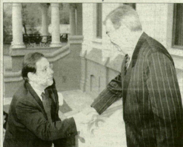
Primakov (jobbról) búcsúzik Solanától. Jó munkát végeztek.