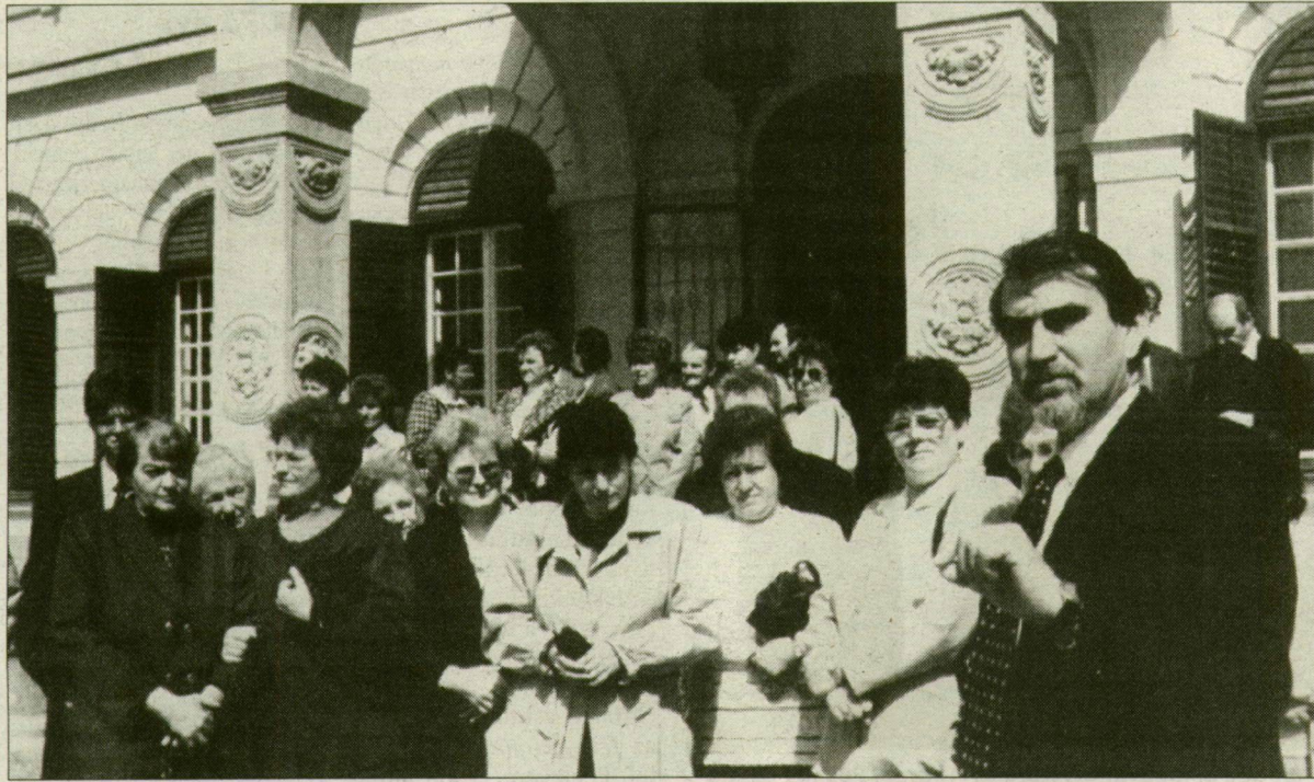
Méltó helyen rendezték meg a megyei műemlékvédelmi találkozót.

A százéves nagymágocsi Károlyi-kastély adott méltó helyet tegnap a műemlékvédelmi megyei rendezvénynek. Nyilvánosan itt hangzott el először az országban az új műemlékvédelmi törvény tervezete. Szóba került a Károlyi-hagyaték története, a nyolcvan holdas kastélypark rehabilitációja, a megye műemlékvédelmi helyzete; a 250 műemlék sorsa.