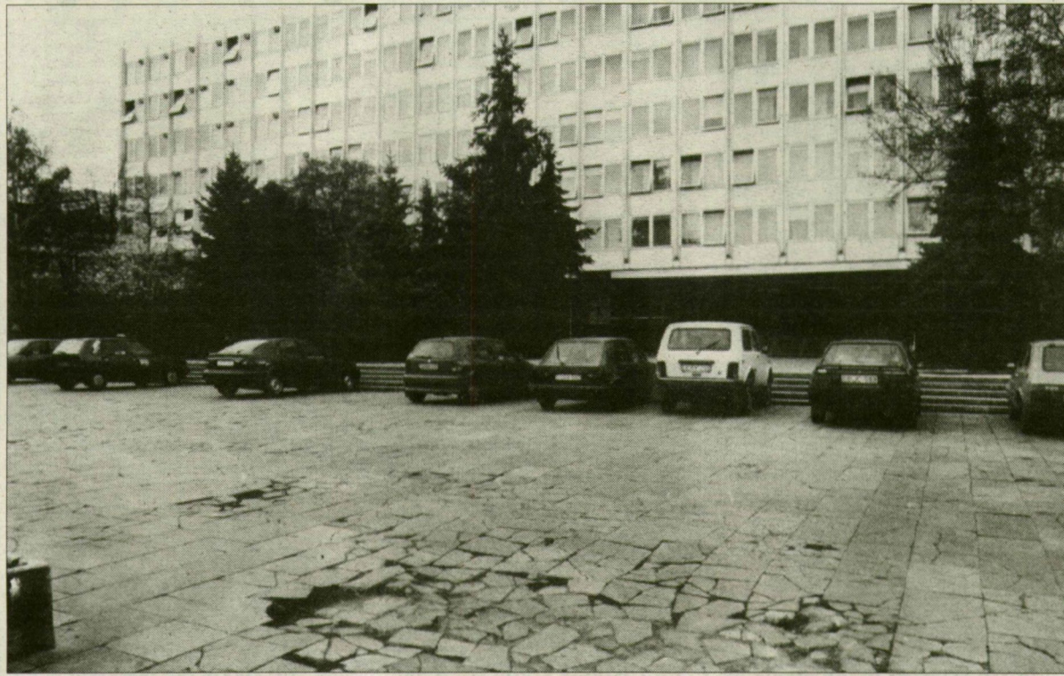
Hárommillióból felújíthatnák a burkolatot. De úgy tűnik, most ennyi pénz sincs...

Összetört márványpok, hatalmas kátyúk, néha örvongésig fölhergelt autók. 5 persze panaszukodó szegediek. Mindez nem a város külterületi állapotainak következménye, hanem a nagyon is belvárosi, Rákóczi téri parkoló akadálypályája miatt lett része napi stresszünknek. De vajon meddig kell még néznünk ezt a márványtemetőt? – kérdeztük két köztisztviselőtől is.