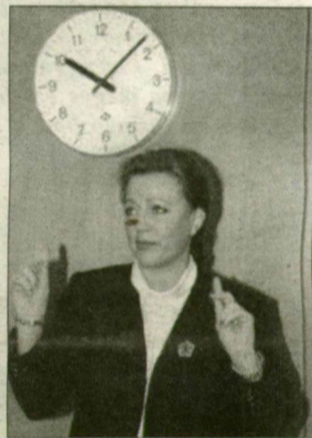
Nem ütött az óra.