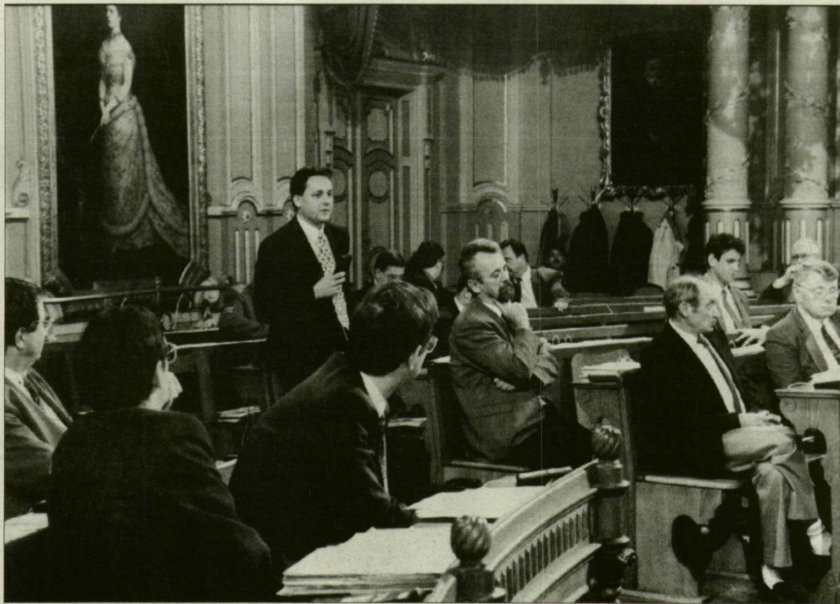
Szónoklat és hallgatás között megszólal a lelkiismeret?

Európát járt deákos diákokat köszöntve kezdődött a szegedi közgyűlés tegnapi ülése. A legsürgősebbnek ítélt ügyekről szavaztak a képviselők, majd visszatértek a napirendhez, s döntöttek és döntöttek – így vagy úgy.