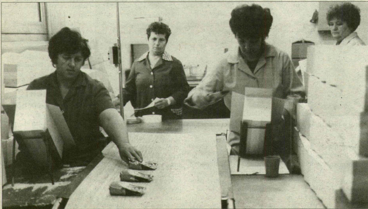
Megy, megyeget a munka is.

Rendkívüli közgyűlésre jöttek össze tegnap, hétfőn a Szegedi Paprika Rt. tulajdonosai, úgy is, mint a Piroska Reorg Kft., valamint az önkormányzatok képviselői. A tanácskozás mindössze 20 percig tartott.