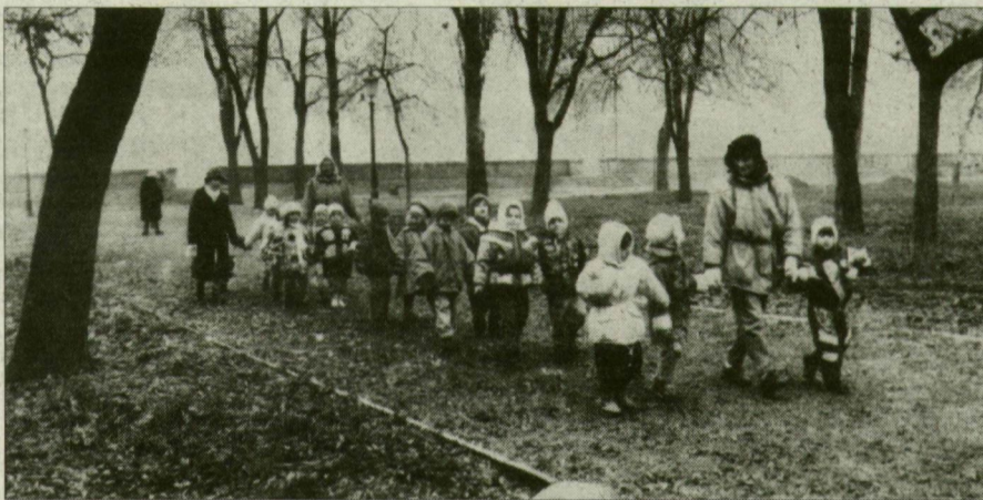
A sétautakon körbejárhatjuk a parktűkröket.

A szegedi Stefánia rendezése húsz éve várattat magára. Tavaly a várrom és a régi Hungária Szálló közti területen (a Várkertben) kezdtek el, s idén folytatták a munkát: megrikították a növényzetet, lefektették az öntözőhálózat gerincvezetékét, új sétautakat építettek. Eddig 11 millió forintot költöttek a területre, amelynek teljes rendezése 30-35 millió forintba kerülne.