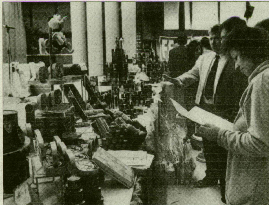
Karácsony előtti mustra.