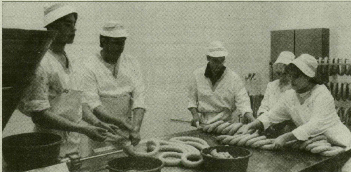
Összesen 60 gyerek gyakorolhat az ország legmodernebb húsiipari tanműhelyében.

– Amikor 1989-ben még éppen csak fölvetették a szakemberek, hogy praktikus lenne az oktatásunkat. 16 éves korban elkezdni, mi már gondolkodtunk egy hasonló