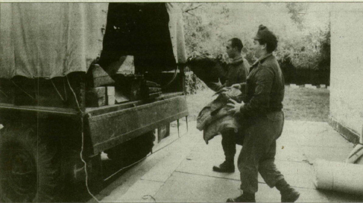
A szegedi laktanyában már csomagolnak...

December 1-jétől megkezdődik az utolsó szegedi katonai alakulat, a Szeged Műszaki Dandár felszámolása, egyben megszűnik a város, mint helyőrség.