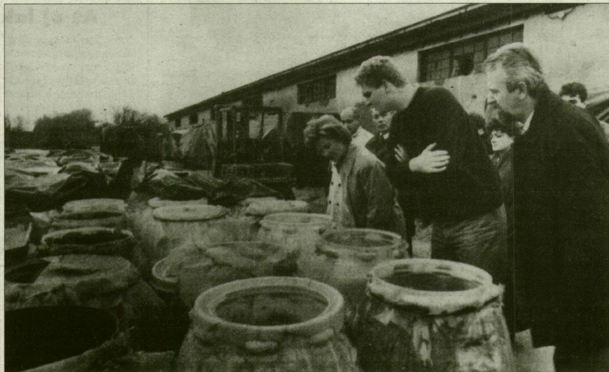
Szili Katalin államtitkár és kísérete a „dolgok” mélyére nézett.

Végre elszáll a viharfelhő az algyői feje fölül. Hosszú évek óta aggódik ugyanis a település lakossága, mi lesz a faluhoz közeli méregtelep sorsa. Az egykori Fémselekt Kiszövetkezet, miután felszámolták, több mint 2 ezer tonna veszélyes hulladékot – zömében galvánszapot – hagyott hátra maga után.