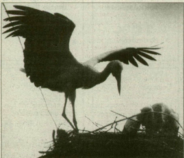
A fiókák reggelijét tényleg a gólyamama hozza.

A szarajevói könyvtár felújítására készített tervezet, amelynek megvalósítása és finanszírozása nemzetközi részvétellel történik, a kiállítástól függetlenül elnyerte a brüsszeli főpolgármester díját is – mondták el szerdán a magyar standok szervezői.