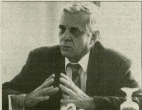
Csapó ezredes már embertelenebbet is látott

– Miért ne beszéljünk? Aki egy kicsit is belegondol a börtönállapotokba, úgyis rájön, hogy a hosszú ideig foga tartott rabok világában a testiségnek ez a formája szinte elkerülhetetlen. A lapangó hajlamok itt kiteljesedhetnek, a párok is megtalálják egymást. Ezzel szemben pedig mindaddig az ör-