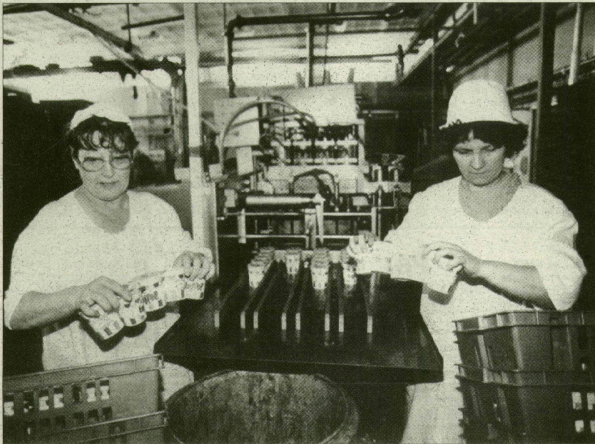
A dolgozóké a gyár. Egyelőre.

A Szegedi Tejipari Rt. vagyona 337 millió forint. Ennek 85 százaléka, vagyis 286 millió 450 ezer forint értékű részvény került ezennel – 105 százalékos árfolyamon, 300 millió 772 ezer forintért – a Szegedtej Privatizációs Konzorcium tulajdonába. (A részvények 15 százalékát visszatartják, egy későbbi fordulóban értékesítik a dolgozóknak.) A privatizációs pályázat szerint zömmel kárpótlási