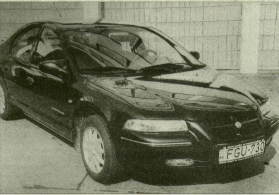
Az egyik főszereplő a Status.