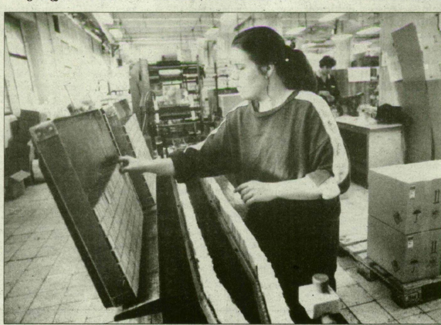
Az automata gép mellett is szükség van az emberre

● A korszerűsítésen kívül mi változott a svéd cég megjelenése óta?