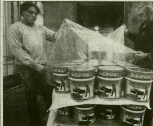
A vonzó külső a festékipiacon is előnyös.