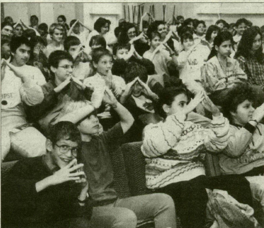
Utánozás – a gyermekek szokása. (Miskolczi Róbert)