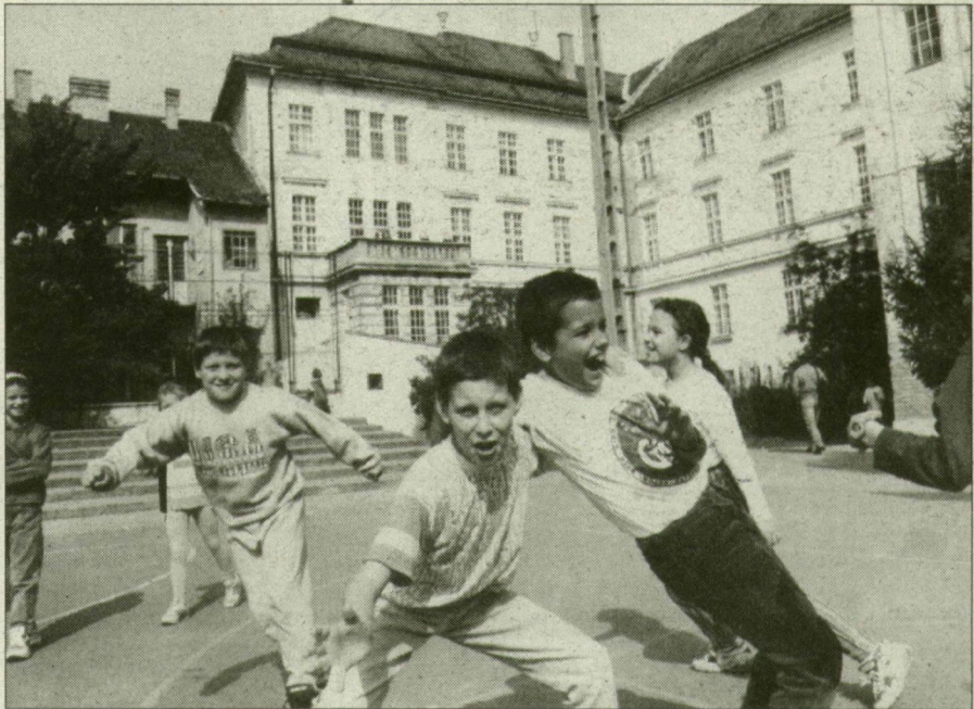
A gyermekek az „összevont” szünetben is felszabadultak.