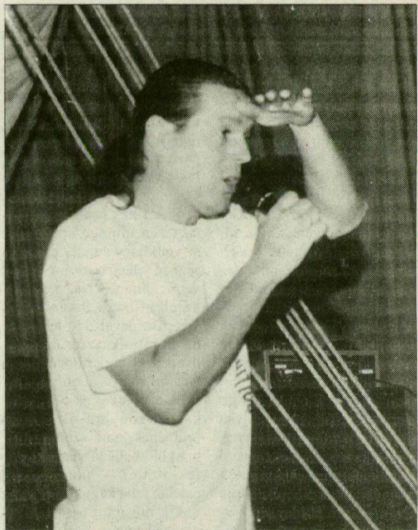
Mórahalomtól messze van Ausztrália...