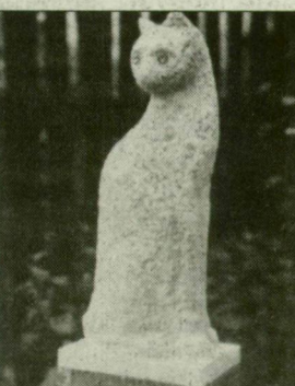
Makk József: Nyaur macska – szobor (kő).