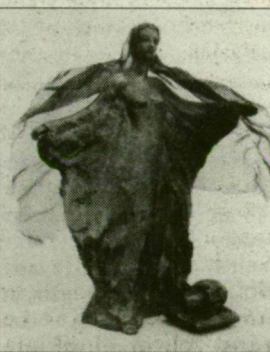
Albert Ildikó: Salome – kispasztika (bronz)