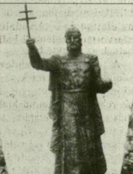
Bánvölgyi László: Szent István – szobor (bronz)