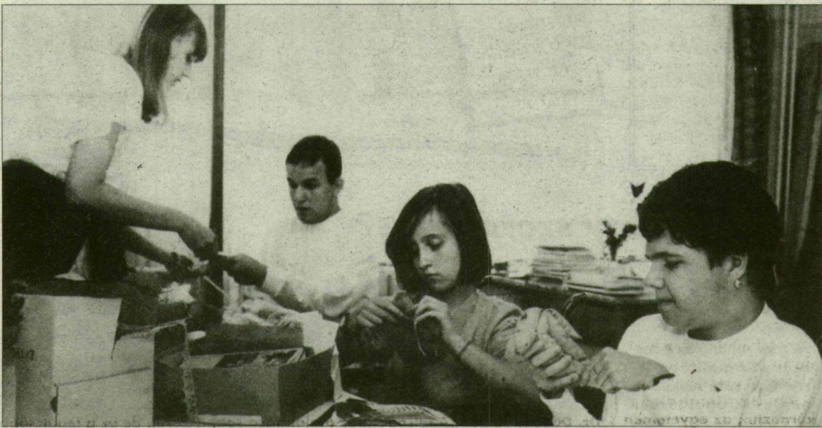
Nekik (is) otthon akarnak teremteni.

Tegnap délután nyílt meg a Korda utca 18-ban az a jótékony kiállítás és vásár, amelynek bevétele az értelmi fogyatékosoknak létesítendő otthon építési költségeinek előteremtését szolgálja. Az otthon a Kálvária sugárút 108-ban vásárolt telken épülne, az előzetes számítások szerint 200 millió forintos költséggel. Az otthon létrehozását szorgalmazó és támogató alapítvány az Értelmi Fogyatékos és Halmozottan Fogyatékos Fiatalok Egyházi Otthonának Alapítványa a beruházási költségeket pályázatok útján és adományokból szeretné előteremteni. A szombaton és vasárnap délelőtt 10 órától délután 18 óráig nyitva tartó kiállításon a szegedi és szeged környéki képzőművészek közel 50 alkotása tekinthető illetve vásárolható meg.