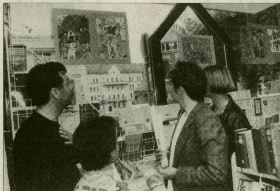
Rajzok a gonoszról és a jóságról.