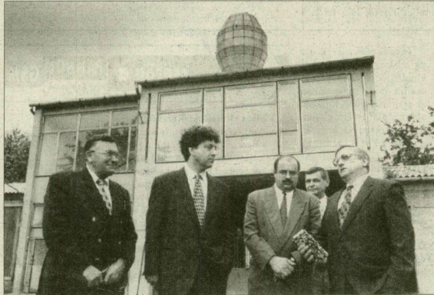
Az SZDSZ pártelnöke, Pető Iván (balról a második) ellátogatott a Pankota Agrár Rt. fábiansbestyáni sertéstelepére is.

Pető Iván a sajtó munkásai előtt előbb néhány országos jelentőségű témában mondott véleményt. Így például kijelentette, hogy Soós Károly Attila ipari államtitkár lemondásának ügyét nem kívánja kommentálni, s azt, hogy Tölgyessy Péter, volt SZDSZ-es pártelnök, pártjukból történő kilépése után - megítélése szerint - a Parlamentben szabadelvű gondolkodóként nem fogja megtalálni helyét. A magyar-román alapszerződésről szólva elhangzott: az SZDSZ annak minden pontjával egyetért, ám szerencsétlen megoldásnak tartja,