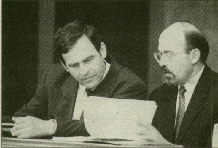
Róluk döntöttek, nélkülük. Tökés László és Markó Béla - RMDSZ