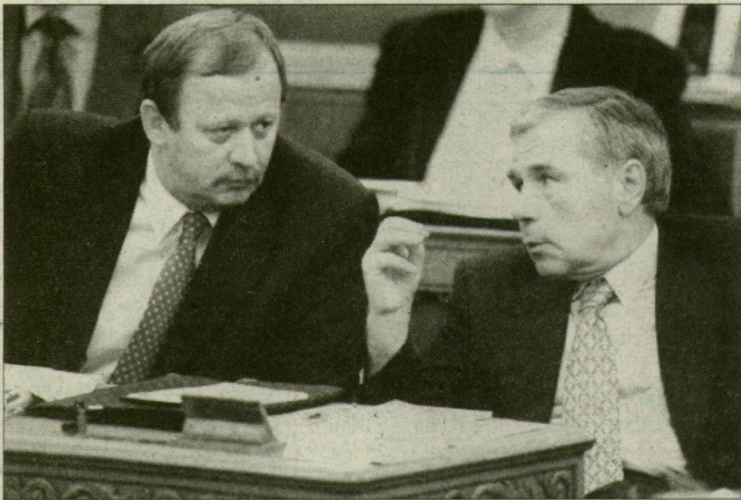
„Közös magyar-román érdek a megbékélés.”