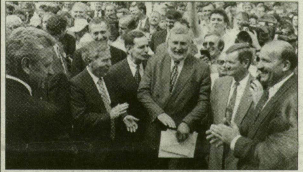
A megnyitó vendégei a Bábolna Rt. kiállításán.