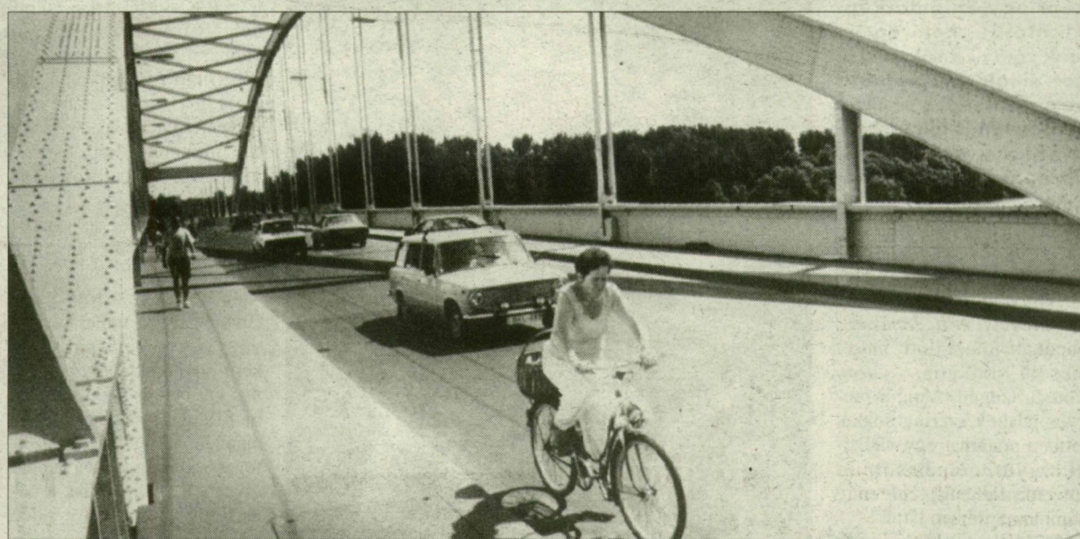
Jött telt a kozmetika az öreg hídnak, amelyen most igazán öröm biciklizni, autózni.

A felújított belvárosi hidat vasárnap adták át a forgalomnak. Tegnap, az első hétköznapon sok autós már erre irányította útját. Az új forgalmi renddel barátkozniuk kell még a járművezetőknek, mert például nem lehet lekanyarodniuk a hídról az Oskola utca felé, avagy befutott a kereszteződésbe a kerékpárút, ami régebben nem volt.