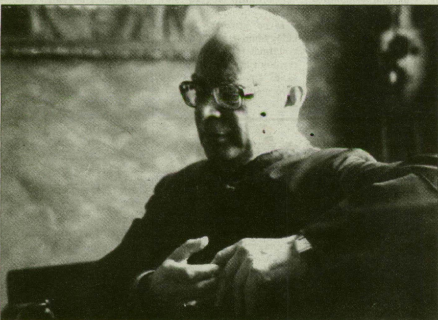
„Az állam az előző rendszer által teremtett viszonyokat menti át.”