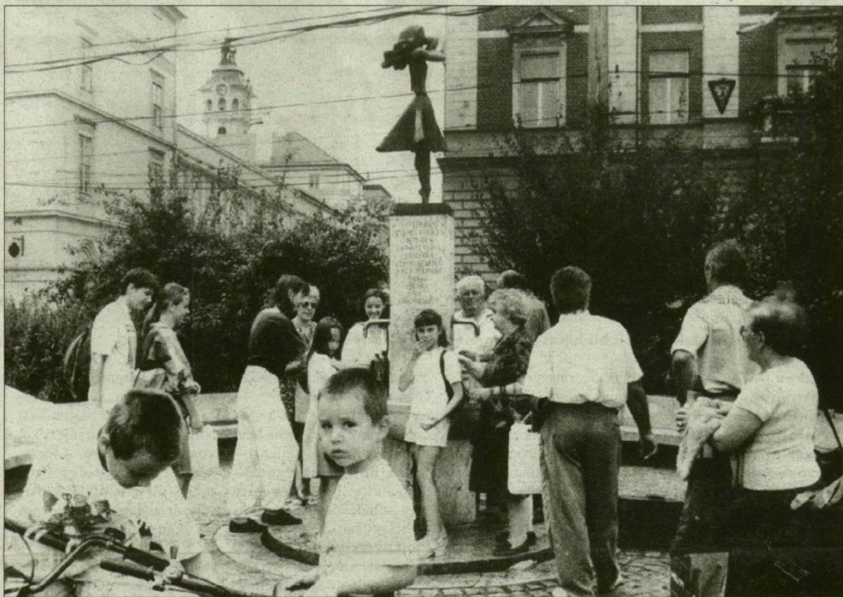
A Tisza Lajos körúton ingyen folyik az Anna-víz. Mégsem ez a vállalkozók gondja...