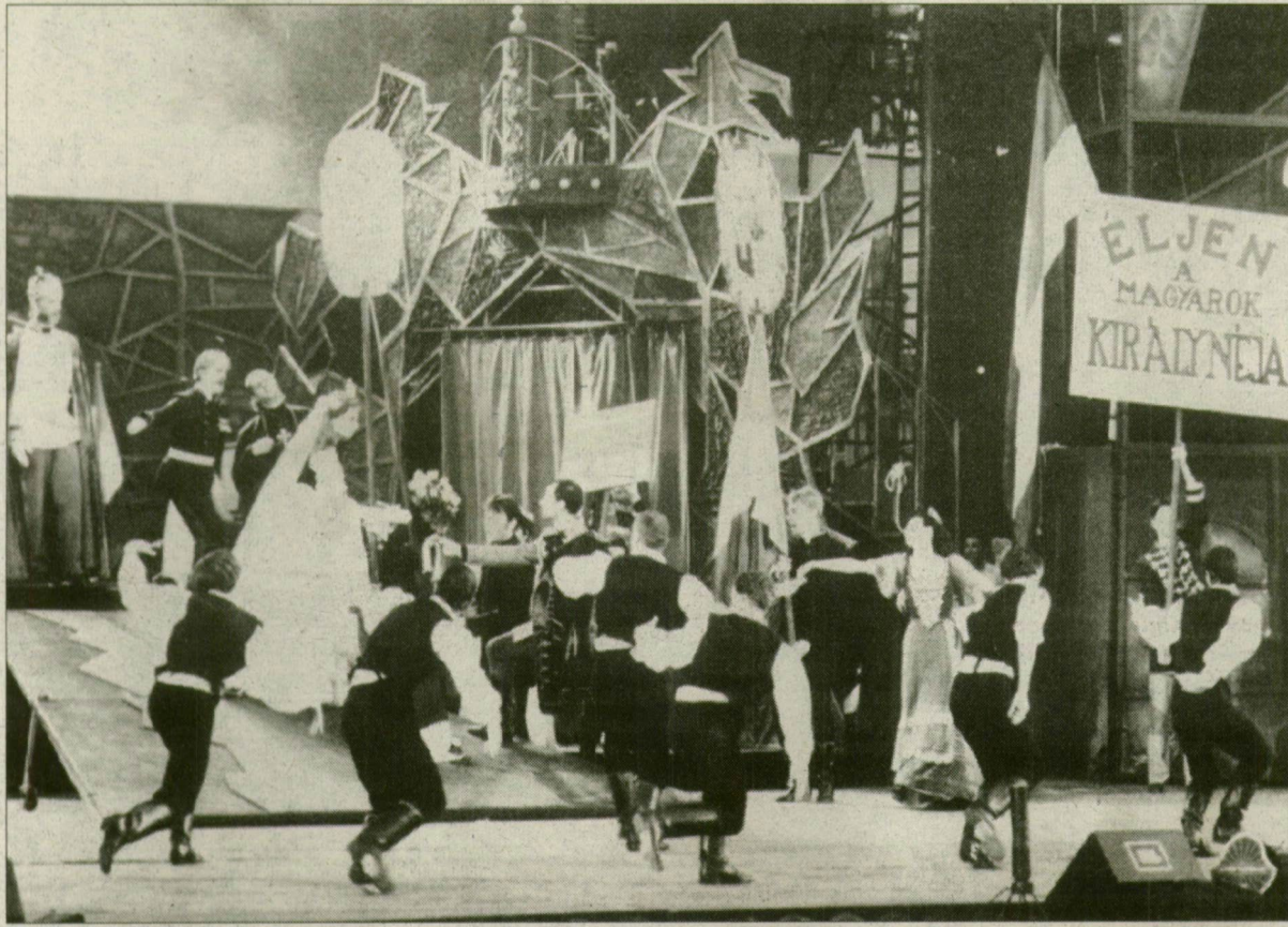
„Éljen a magyarok királynéja”.

Erős történet olvad össze jó zenével és színvonalas koreográfiával – ez a musical-siker alapfeltétele. A végóráihoz közelebb Monarchia történelmébe ágyazott regény, Erzsébet királynő élettörténete attól lesz erős Michael Kunze (Müller Péter Sziámi-fordította) librettójában, hogy tele van személyes drámmakkal. És attól, hogy – az írói érzékenységnek hála – mégsem válik holmi melodrámmá.