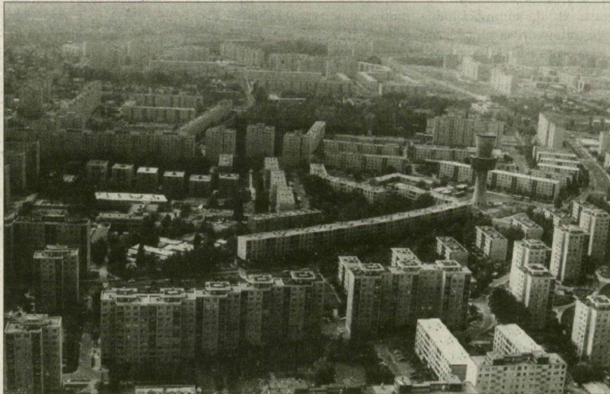
Szeged jellegtelen lakótelepei is megszipülnek a magasból.

azt a bungee jumping és a tandem ejtőernyős ugráshoz hasonló módon a vállalkozó szellemű emberek kipróbálhatják az augusztus 18-i repülőnapon, a műrepülő bemutatón, a kötelekreplést, a modellbemutatót is tartalmazó programozatot valamelyik szünetben.) A kétszer hat üléses utastér nem kényelmi célokat szolgál. Míg a füves kifutón