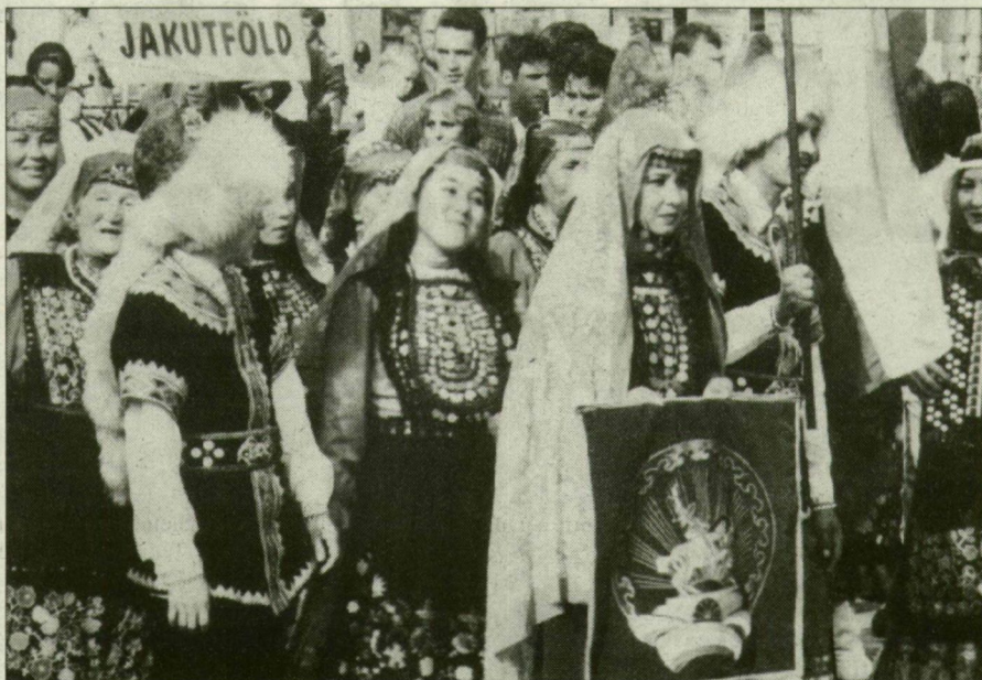
A Dugonics téren bemutakoztak az együttesek

Udmurtföld, Jakutföld, Észak-Osztétia; Piroksa Táncegyüttes – Finnország; Transilvania Táncegyüttes – Románia; baskfrok; magyarok. A táncoló együtteseket persze nemcsak a magukkal hozott táblák különböztették meg, hanem a viseletet, a tánc, a zene. Tarkaságukban, sokféleségükben gazdag és érdekes képeket villantottak fel a a folklór követői. Az