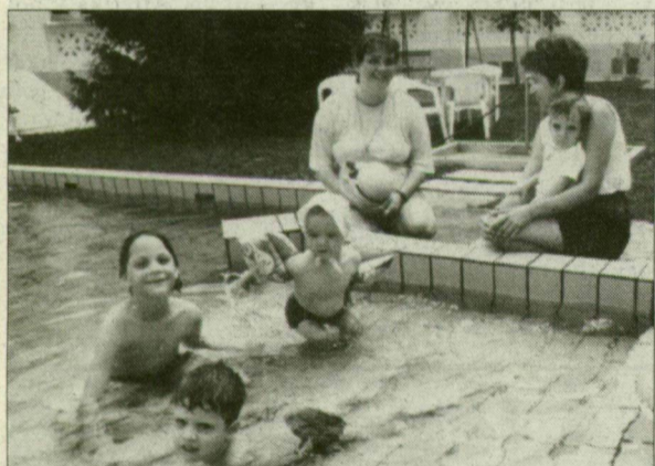
Ugy élvezem én a strandot...

A vásáryitő napján, július 5-én, átadták a város első bébistrandját a Tisza Lajos körüti fürdőben. A fürdőt 1896-ban létesítették és a száz éves évforduló tiszteletére építették a strandot a kicsik számára.