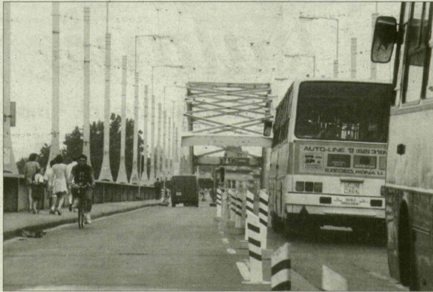
A szegediek visszakérték a forgalomnak a régi hidat.

Lássuk hát az eredményeket! A 159 kitöltött „lakossági” kérdőív kiderült, hogy a hídlejárás előtti forgalmi viszonyok visszaállítását szeret-