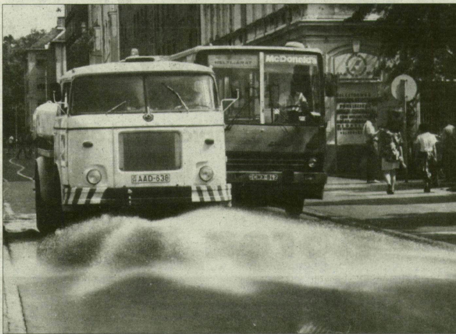
Locsolóautót csak ritkán látni.

Az ÁNTSZ munkatársai nem végeznek méréseket a város külterületein, a forgalmi gócpontoktól távolabb eső városrészekben, de a Szeged közeli települések – mint például Székkutas, Zákányszék, Ásotthalom – mérései eredményeit, a hasonló adottságok miatt, ugyanolyannak tekintik, mintha azokat Szeged peremkerületeiben mérték volna. Az eredmények azonban itt sem sokkal jobbak a for-