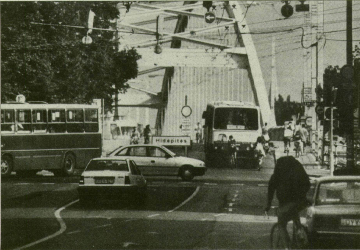
A Tisza közelében is az egészségügyi határérték fölött van a levegő portartalma.