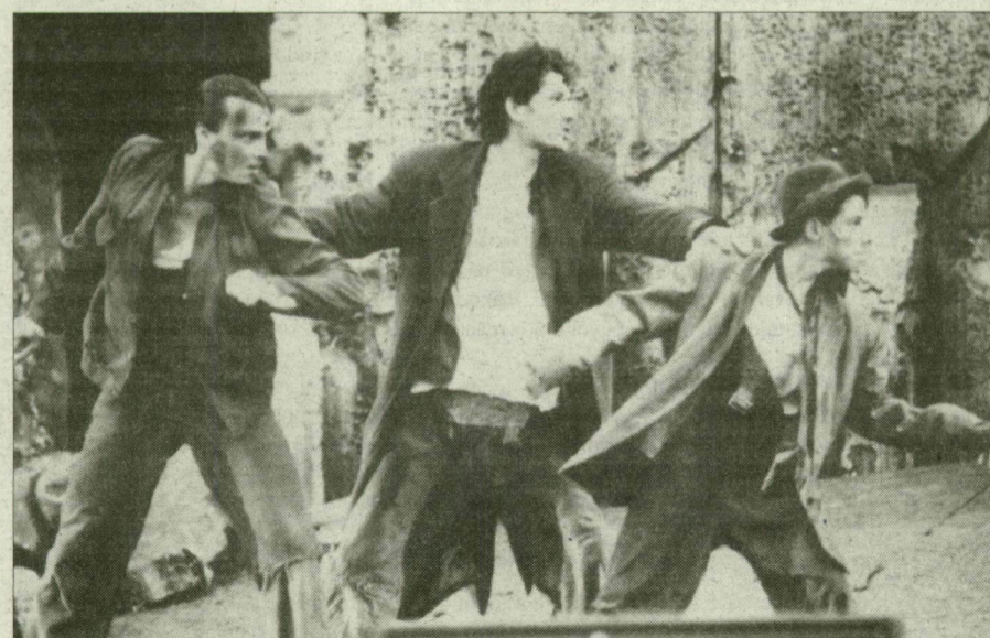
Csütörtöktől ismét a szabadtéri színpadán a Valahol Európában című musical.