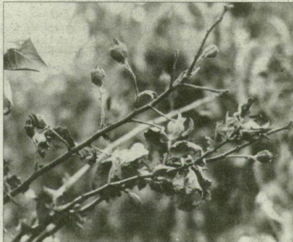
A tűzelhalás jellegzetes tüneteit a kiszombori kertekben is észlelték.

A Csongrád Megyei Növény-egészségügyi és Talajvédelmi Allomás növényegészségügyi zárlatot rendelt el a napokban Makó közigazgatási területén, mivel itt is felbukkant a tűzelhalás nevű növénybetegség. Az ügyben érdekelt kert- és kiskerttulajdonosok számára július 31-én, szerdán 18 órától a makói Hagymaházban lakossági fórumot tartanak.