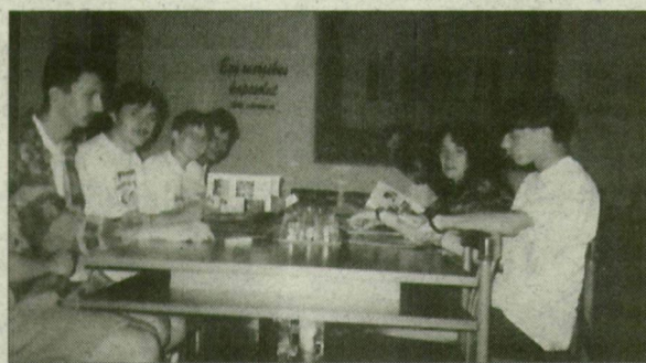
Erdélyi diákok a szegedi gyakorlaton.

Több éve már, hogy a Dél-Magyarországi Áramszolgáltató Rt. ven- dégül lát szakmai gy- akorlatra külföldi magyar diákokat. Az idén erdélyi és felvidéki magyar diákok töltöttek náluk egy-egy hetet. Az erdélyiek a marosvásárhelyi és a temesvári Műszaki Egyetem automatizálási és erősáramú karáról érkeztek.