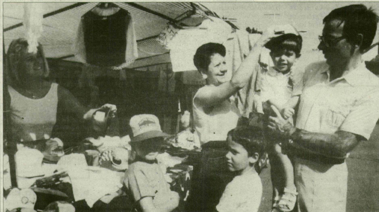
Vásárfia is került mindenki kezébe...