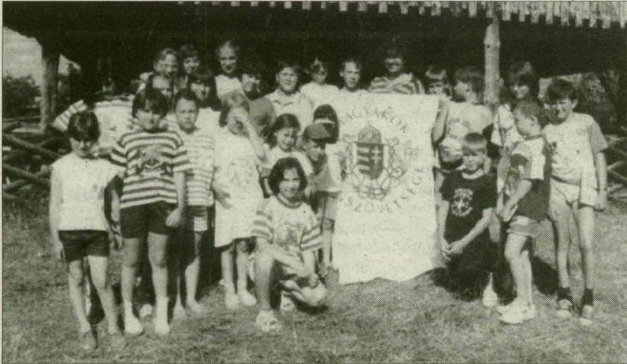
A vetélkedőn is jól szerepeltek a vajdasági diákok

Gyümölcsözőnek ígérkező kapcsolat alakul ki a vajdasági Ada hagyományörzői és szegedi, illetve Csongrád megyei szervezetek között.