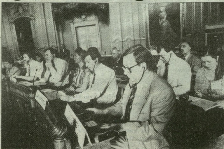
A szegedi városházán zajlott tanácskozáson arról is szó esett, miként lehetne javítani a foglalkoztatás helyzetén.