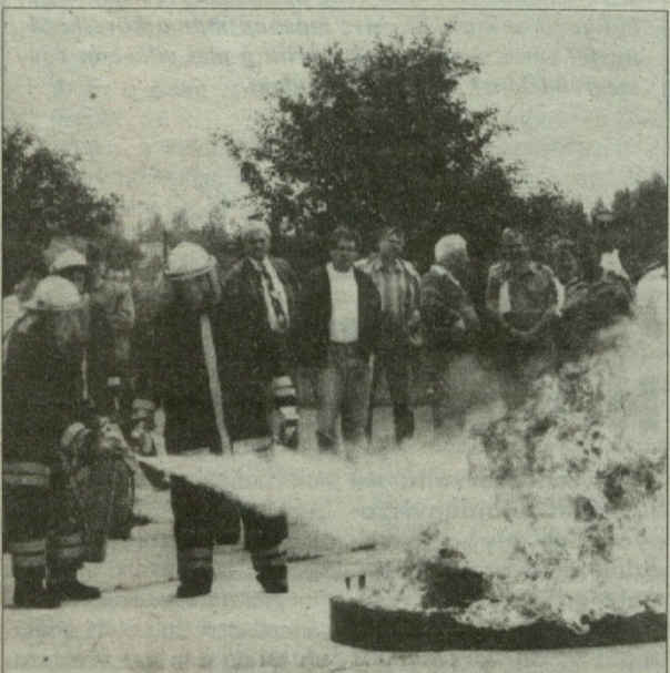
A Bonpet zárt térben jeleskedik, a szabadban lévő tüzeknél a „poroltókat” alkalmazzák.

Főként a szakemberek álmélkodtak, de a laikusok számára is látványos mutatványt produkált az a japán oltóanyag, amelyet tegnap mutattak be a megyei tűzoltóparancsnokság algói telepén. Az égő faházat az üvepalackba zárt folyadék – a hő hatására szétroppant fiolából kiömölve – tényleg másodpercek alatt oltotta el, hatása sokszorosa az egyéb készülékekének. Vízrel hígítva is hatásos. Pedig csupán 6 deciliteres a Bonpet nevű készülék tartalva.