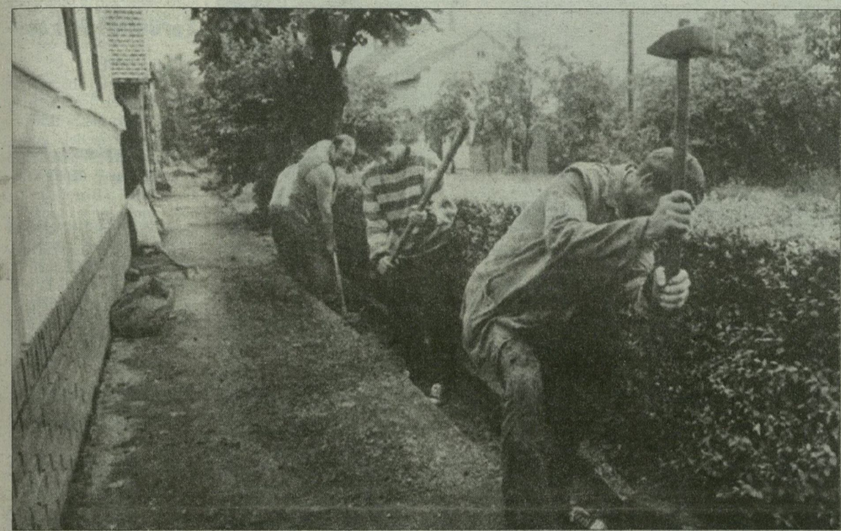
Pásztor utca: nem éppen leányálom esőben árkot ásni!