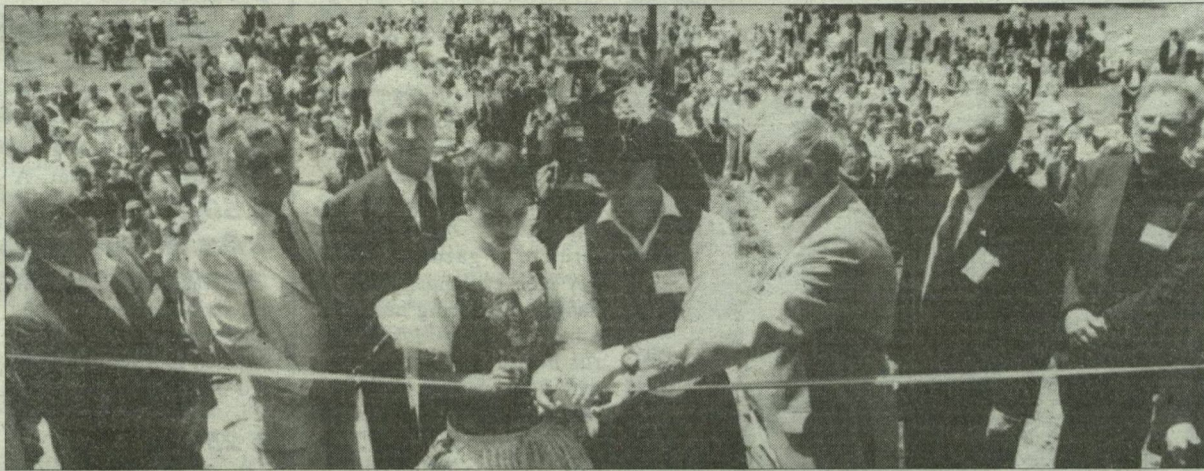
Felavatták a Magyarok Világszövetsége kiállítási pavilonját.

Ópusztaszer tegnap, pénteken a világ magyarságának találkozó és emlékező helye volt. A tárogató hangjainak szívet melengető muzikájától kezdve, a katonai tiszteletadástól át a különféle műsorokig minden arra emlékeztette a jelenlétet, hogy olyan történelmi pillanat részese lehet, mely talán csak száz évenként jön össze.