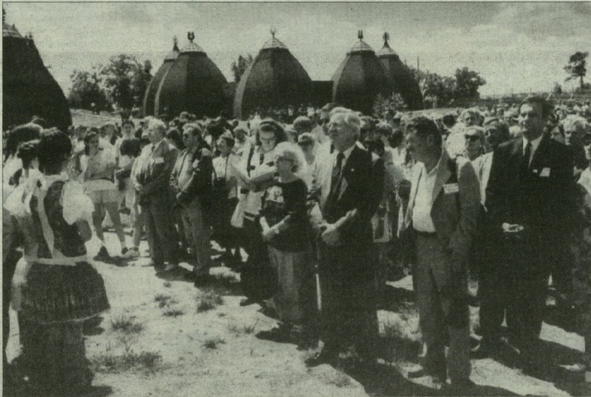
Kétezren jöttek el a világból.