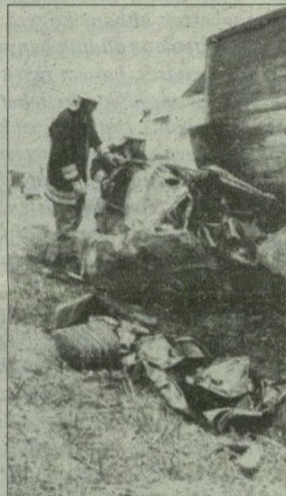
A véletlen utasokon már nem lehetett segíteni...

A vele szemben szabályosan haladó Daewoo típusú autó vezetője, hogy elkerülje az ütközést, lehajtott az útpadkára, majd a kormányt visszarántotta. Ekkor frontálisan ütközött egy szintén szabályosan haladó Scania típusú pótkocsis teherautóval. A személyautó pillanatok alatt lángokba borult. A balesetben véletlen Daewooban két felnőtt és két gyermek tartózkodott. A két fel-