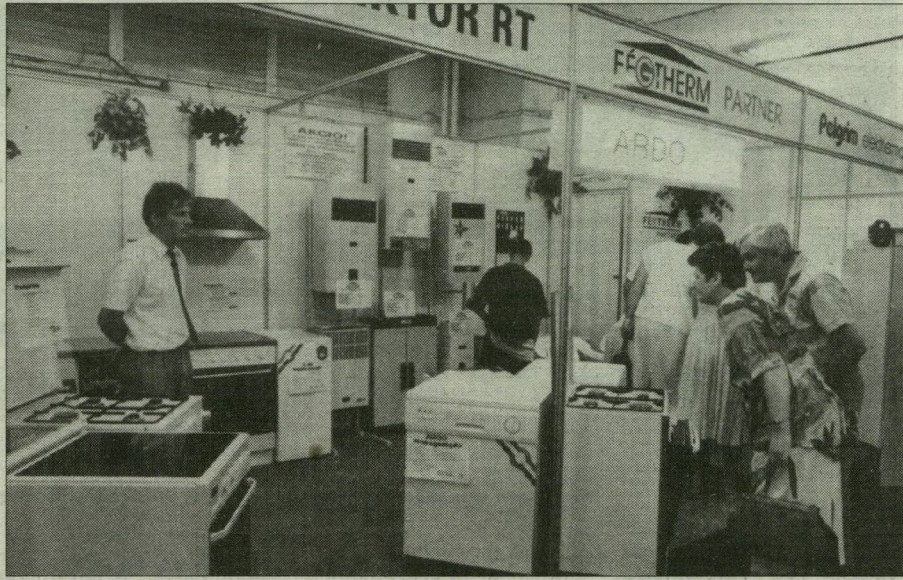
Jellemző stand a tavalyi vásárról