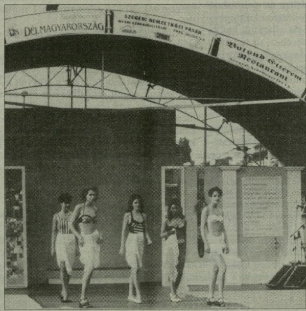
A műsor ma már elengedhetetlen

Karélia területén a burgonyán kívül semmi nem terem meg. Fában, vízben gazdag köztársaság, s mint Efinov Vitaliy Boriszovics, az oroszországi föderáció magyarországi kereskedelmi tanácsosa megerősítette, fizetőképes.