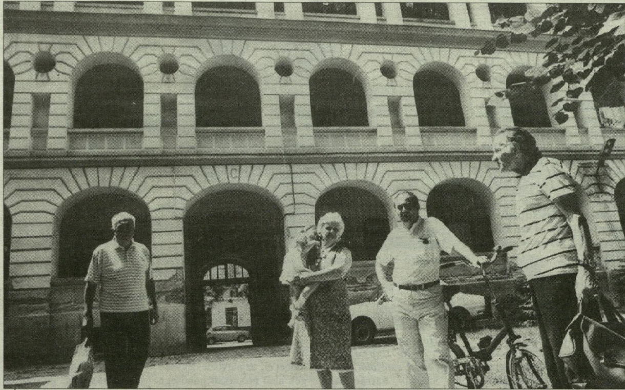
A Honvéd téren lesz az Aula Magna.

és a tanárképző főiskola két-két karral, a SZOTE jelenlegi három karával és az egészségügyi főiskolai képzéssel lép a szövetségbe.