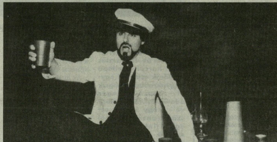
A színpadon már nem lehet hibázni.