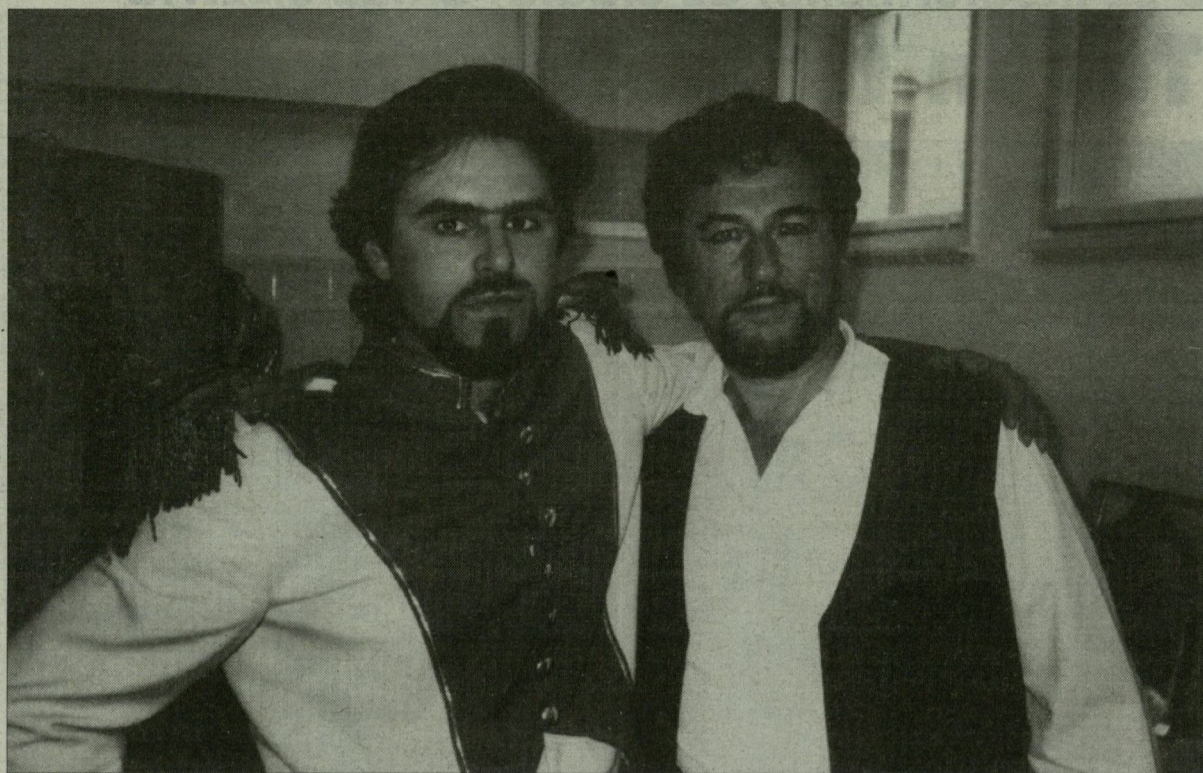
Apa és fia – munkaruhában