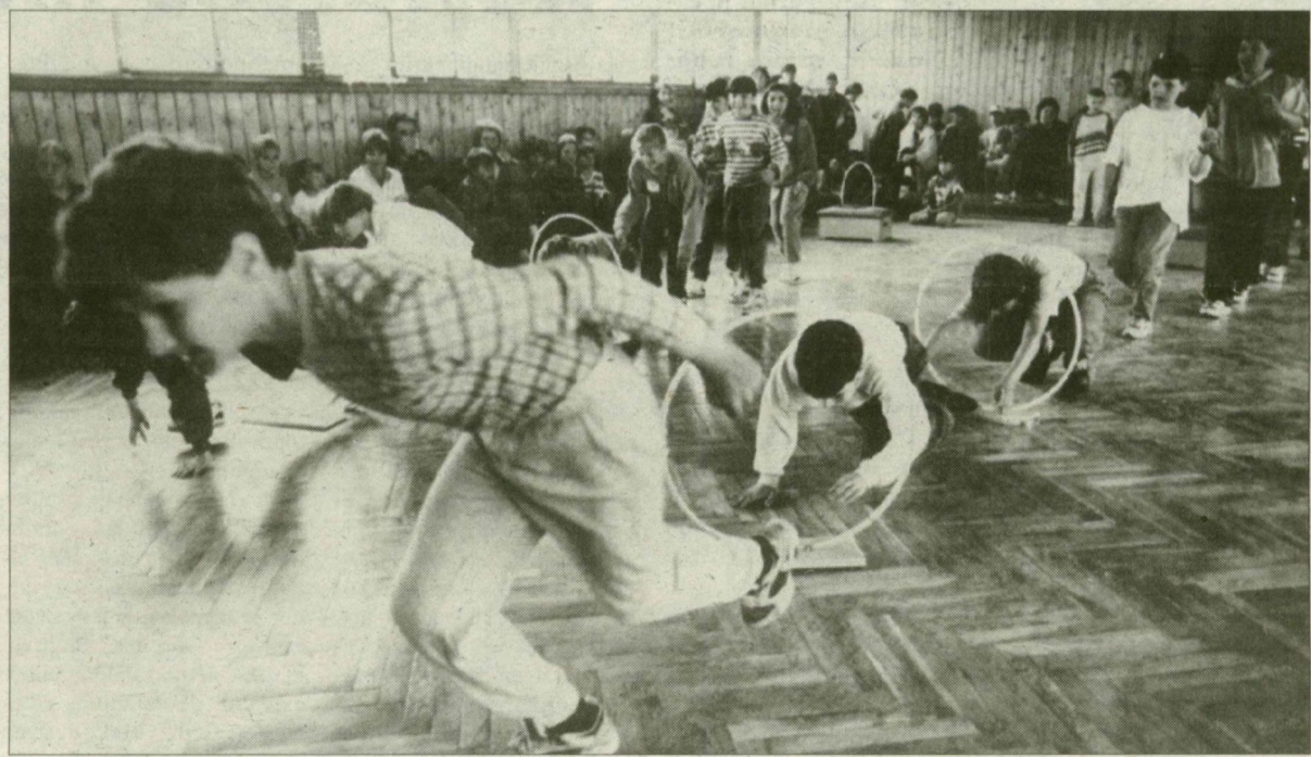
Forráskúton sem a zord idő, sem a karika nem jelentett akadályt.

A kanadai kezdeményezésű Challenge Day, vagyis a kihívás napja immár hatodik alkalommal „bolondítja meg” Szegedet, de főként vonzáskörzetét. Az ország 512 települése nevezett az idei, tegnapi rendezett, mókás, játékos sportvedélkedőket (is) kínáló napra, Csongrád megye 21 faluja, városa csatlakozott, fogadta el a kihívást. A kihívást, hogy az év legalább egyetlen napján felálljunk a fotelból, sutba dobjuk kényelmes életmódunkat és sportoljunk egy kicsit. Lehet, hogy a berzsdásodott tagok először nehebben engedelmessé váltak a parancsnak, de... Ha a kicsik megszerették, a nagyok újra elsajátították a mozgás művészetét, már megérté.